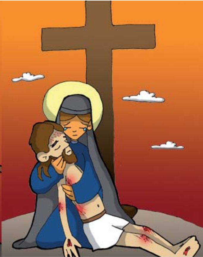
13º ESTACIÓN: JESÚS ES BAJADO DE LA CRUZ