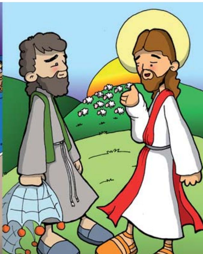
11º ESTACIÓN: JESÚS CON- FIRMA A PEDRO EN EL AMOR