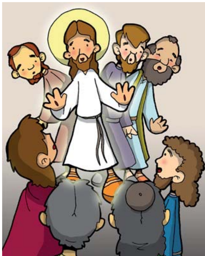
6º ESTACIÓN: JESÚS MUESTRA SUS LLAGAS EN EL CENÁCULO