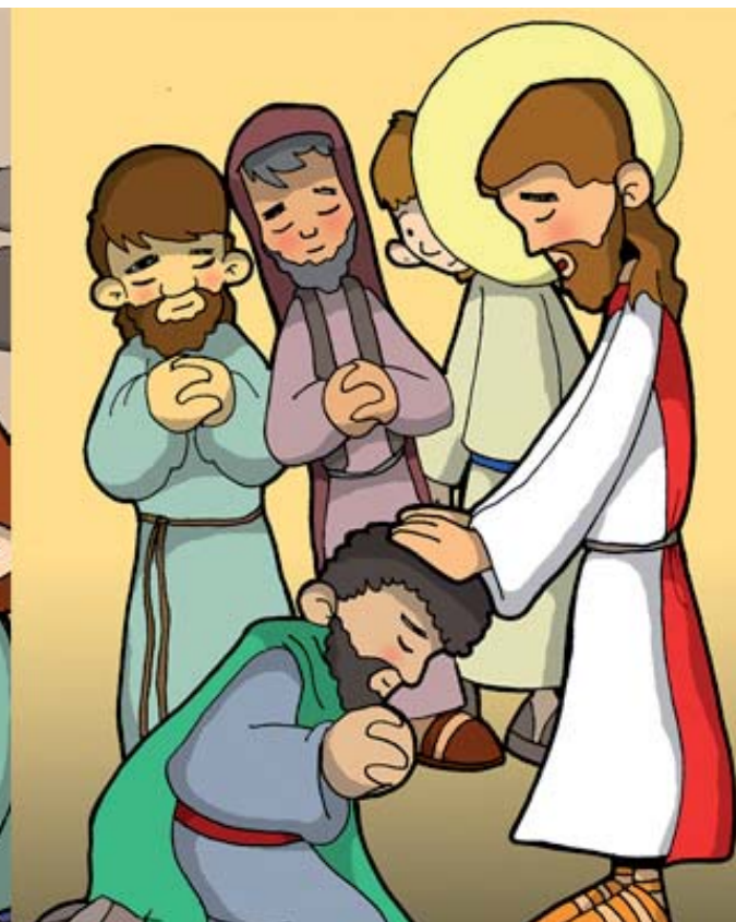
8º ESTACIÓN: JESÚS DA A LOS APÓSTOLES EL PODER DE PERDONAR LOS PECADOS