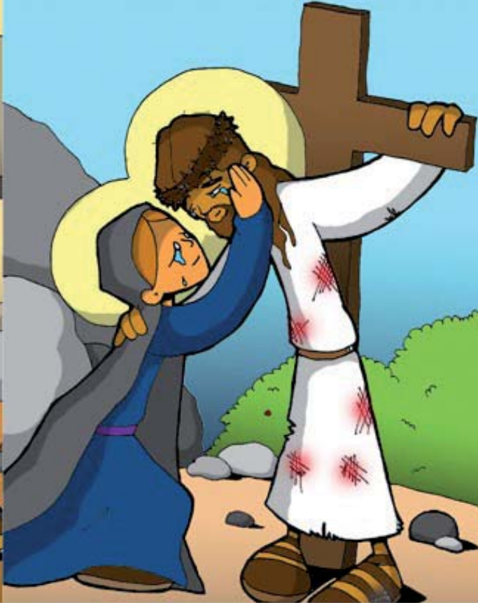
4º ESTACIÓN: JESÚS SE ENCUENTRA CON SU MADRE