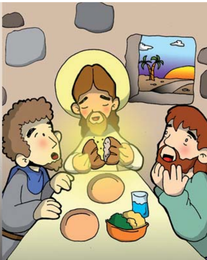
7º ESTACIÓN: EL CAMINO A EMAÚS