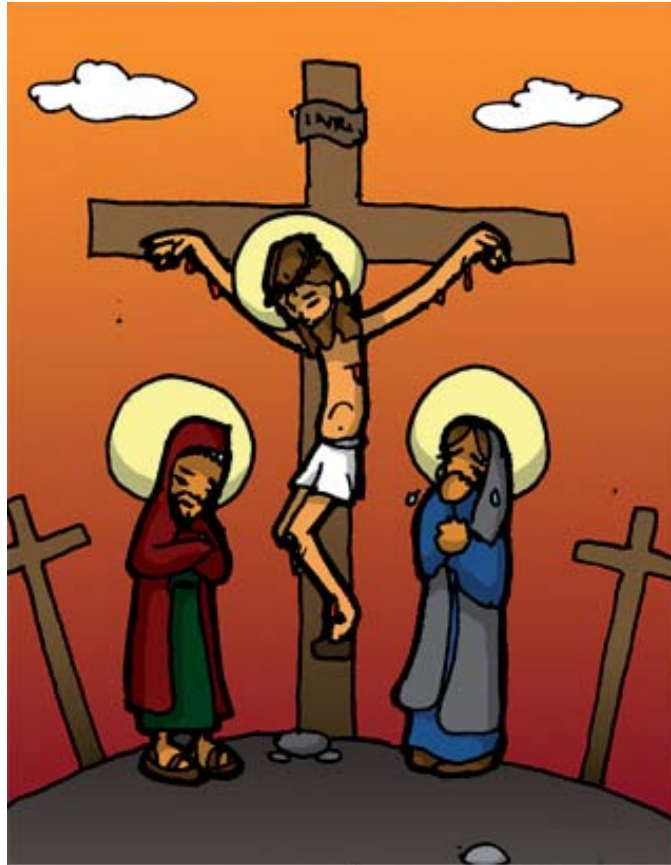
12º ESTACIÓN: JESÚS MUERE EN LA CRUZ