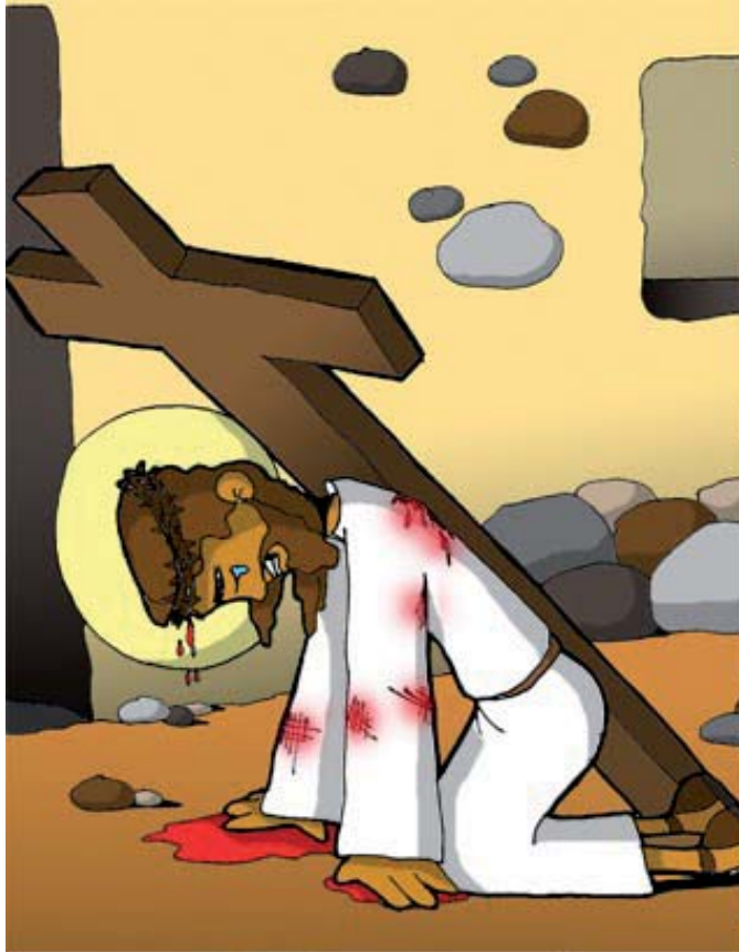
3º ESTACIÓN: JESÚS CAE POR PRIMERA VEZ