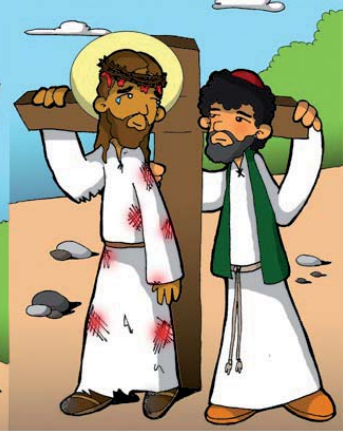
5º ESTACIÓN: EL CIRENEO AYUDA A JESÚS A CARGAR LA CRUZ