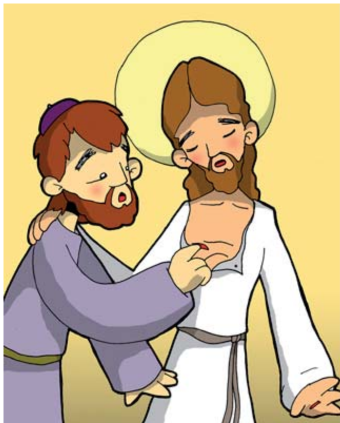
9º ESTACIÓN: JESÚS FORTALECE LA FE DE TOMÁS