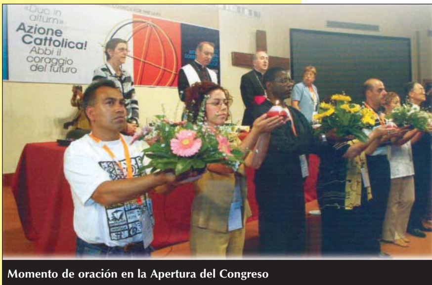
Momento de oración en la Apertura del Congreso

A la Acción Católica de todo el mundo, Juan Pablo II ha señalado tres testimonios - Alberto Marvelli , Pina Suriano y Pere Tarrés , un joven, una joven y un sacerdote- y a confiado tres consignas: contemplación , comunidad y misión para mirar el futuro con coraje y esperanza.