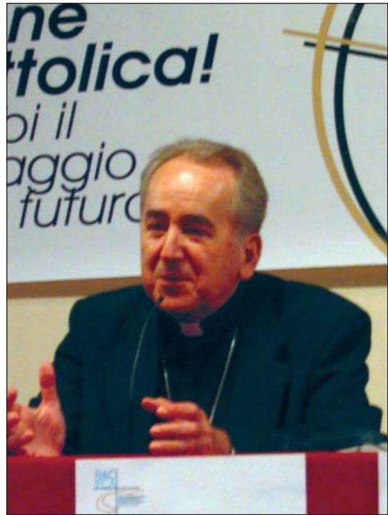
Monseñor Rylko en su intervención en el Congreso

Es una asociación laical muy notable, de larga historia y muy rica en sus frutos. Pensamos en tantas generaciones de fieles, hombres y mujeres, jóvenes y adultos, para los cuales la Acción Católica ha sido y es aún hoy una escuela de sólida formación cristiana. Cuánto compromiso apostólico y amor por la Iglesia ha conseguido desencadenar en tantos fieles. Para cuántos laicos se ha convertido en una escuela de radicalidad evangélica y de auténtica santidad. Es muy extenso, en efecto, el elenco de santos y beatos que se cuentan entre las filas de los miembros de Acción Católica. Cuántas vocaciones sacerdotales, y religiosas han nacido de entre sus filas. Ha sido propiamente la Acción Católica quien preparó el terreno para la "hora del laicado" en la Iglesia de nuestro tiempo y para la renovación de la teología del laicado que ha llegado a su cumbre en las enseñanzas del Concilio Vaticano II . Qué rico es el magisterio que los Pontífices han querido dedicar a esta