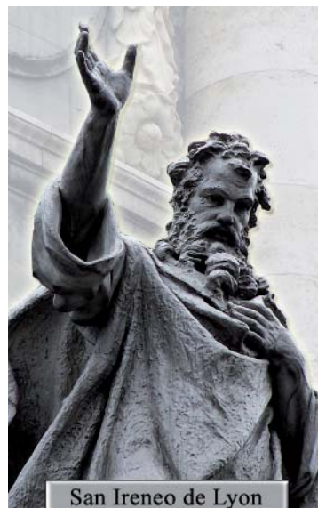
San Ireneo de Lyon

Ireneo fue uno de los primeros pensadores cristianos que dio una forma sistemática a sus ideas. En el centro de su fe descansa su convicción de que el Dios invisible, desconocido, creador de todo, amó tanto a la humanidad que se volvió un ser humano como nosotros. Lo que hace particularmente atrayente el pensamiento de Ireneo es esa noción de «vida». Estamos invitados a entrar en una vida que es simplemente el amor que Dios desea compartir con nosotros. El acto de atravesar el inmenso abismo que le separaba del cosmos físico, invitando al ser humano a una vida como la suya, Dios no lo pensó más tarde: estuvo desde el origen en el proyecto del amor divino. Somos amados tal y como somos y por lo que podemos llegar a ser en la comunión que Dios nos ofrece.